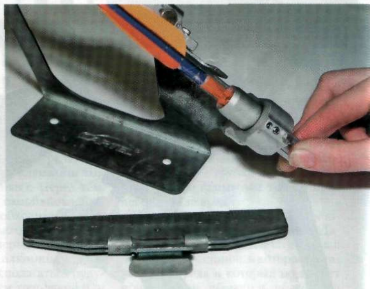
Для поклейки следующего пёрышка достаточно просто повернуть на пероклейке выступ для хвостовика стрелы по часовой стрелке до щелчка

Всё. Только до полного высыхания клея должны пройти сутки. Так что всегда имейте в своём колчане запасные стрелы. Кстати, желаю вам всегда иметь запасные варианты на все случаи жизни и в Новом году. С праздником!