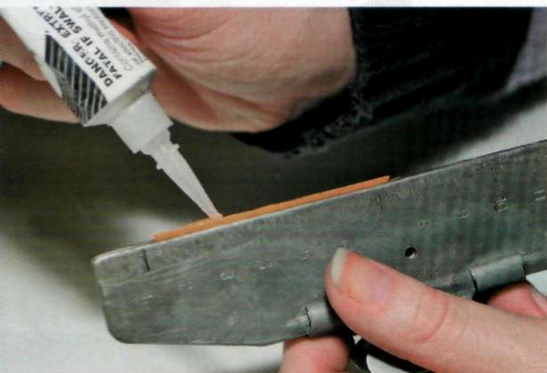
Равномерно распределяем клей по основанию перышка