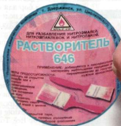
Варианты пёрышек (слева направо): пластиковое, резиновое, «индюшка»