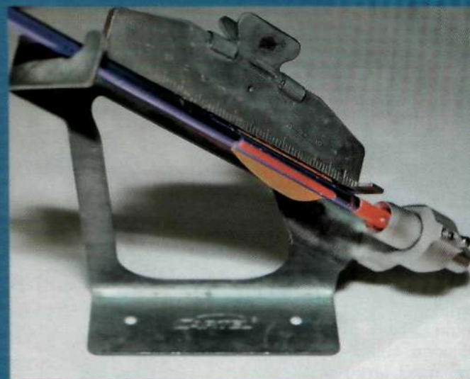
После нанесения клея и ровного его распределения по основанию пера плотно прижмите проклеенную часть к трубке стрелы так, чтобы зажим примагнитился к пероклейке

нанесения клея и его ровного распределения по основанию пера, плотно прижмите проклеенную часть к трубке стрелы так, чтобы зажим примагнитился к пероклейке. Ждём 3 минуты.