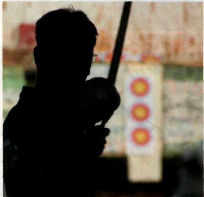
ТЫ, ЛУК И МИШЕНЬ, И НИКАКИХ ДРУГИХ МЫСЛЕЙ В ГОЛОВЕ БЫТЬ НЕ ДОЛЖНО.