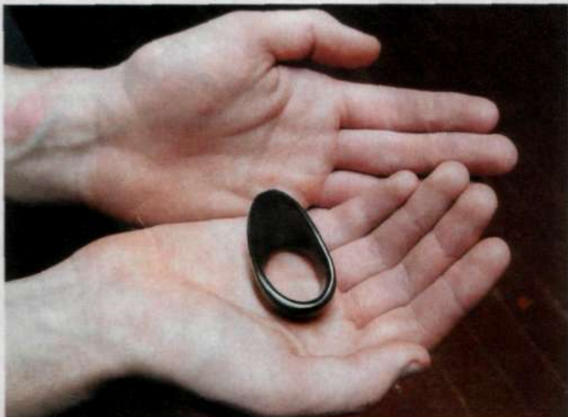
КОЛЬЦО ДЛЯ СТРЕЛЬБЫ ИЗ ТУРЕЦКИХ ЛУКОВ.