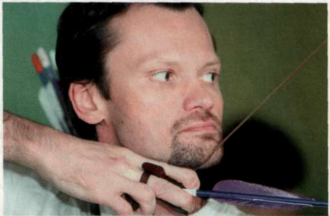
ОДИН ИЗ ПРАВИЛЬНЫХ ВАРИАНТОВ ПРИКЛАДКИ ПРИ СТРЕЛЬБЕ ИЗ ТРАДИЦИОННОГО ЛУКА.

К прямым лукам также можно отнести и японский Юми. Этот лук полон загадок. Ну, хотя бы потому, что стреляли из него в стране Восходящего солнца, в стране! И сами лучники считают стрельбу из Юми не совсем стрельбой. Поясню. В Японии стрельбу из лука возводят в особый вид искусств, называемый Кюдо. В Москве, кстати, уже есть Федерация Кюдо, руководители которой обучались у настоящих японских мастеров. Что такого особенно в этом луке? Во-первых, сразу бросается в глаза его необычная конструкция. Верхнее плечо значительно превышает по размерам нижнее. Сам по себе лук имеет длину 2 м 21 см. Суть искусства Кюдо заключается в том, что стрелку в самом процессе принадлежит лишь второстепенная роль. Действия человека здесь имеют двуединый характер: лучник стреляет и попадает в цель вроде бы сам, но, с другой стороны, это обусловлено не его