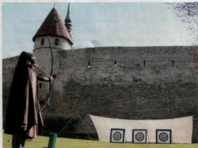
СТРЕЛЬБА ИЗ ЛУКА ФЛЕТБОУ ПОД КРЕПОСТНЫМИ СТЕНАМИ СТАРОГО ГОРОДА В ТАЛЛИННЕ.

в голове быть не должно. А когда выиграешь по-настоящему, можно наслаждаться своим триумфом в полной мере. Вот так и переплетаются умения японских мастеров и профессиональных спортсменов-лучников.