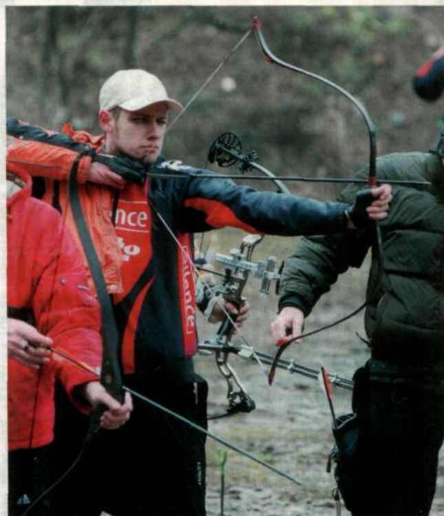
СТРЕЛЬБА ИЗ ТРАДИЦИОННОГО РЕКУРСИВНОГО ЛУКА.