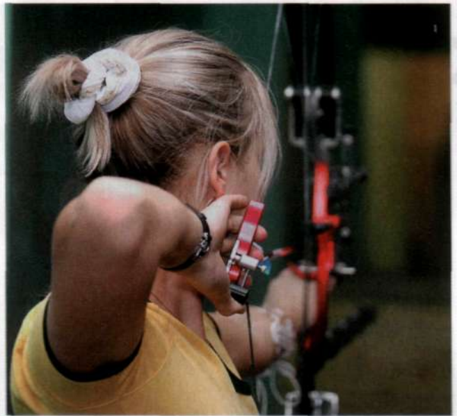
В ЗИМНИЙ СЕЗОН (С СЕНТЯБРЯ ПО МАЙ) ОСНОВНАЯ ДИСТАНЦИЯ СОСТАВЛЯЕТ 18 М.

ЛЕТОМ ЛУЧНИКИ СОРЕВНУЮТСЯ НА БОЛЕЕ ДАЛЬНИЕ РАССТОЯНИЯ: ЖЕНЩИНЫ — НА 30, 50, 60 И 70 М, А МУЖЧИНЫ — НА 30, 50, 70 И 90 М (НА СНИМКЕ — 70 М).