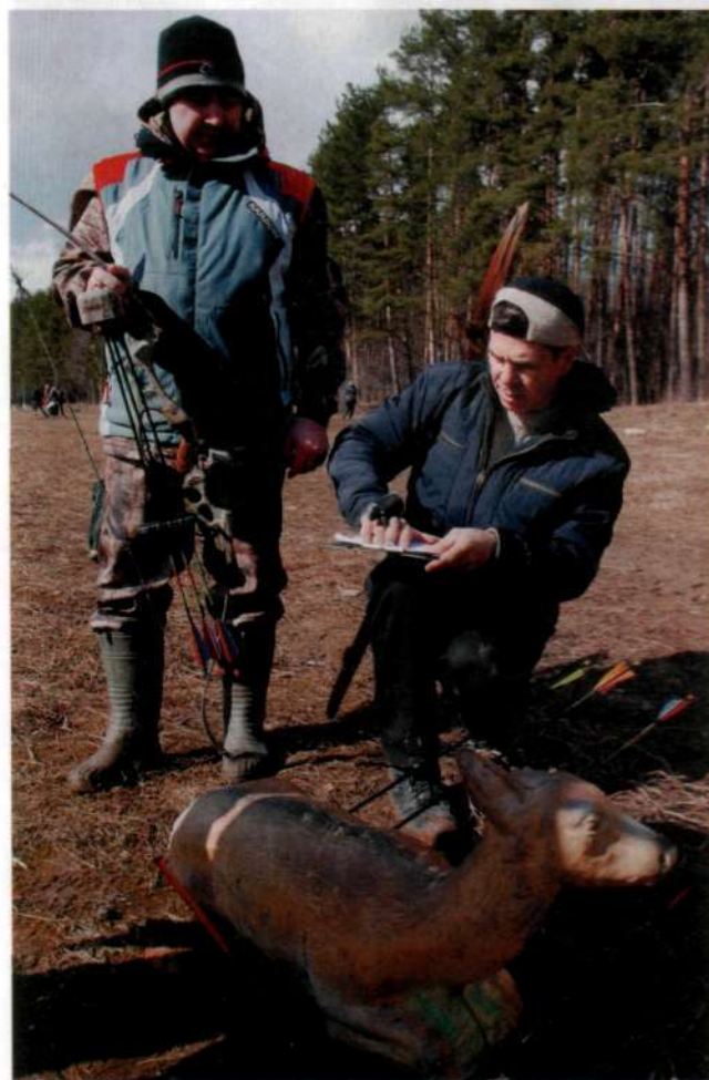
ПОДСЧЁТ ОЧКОВ НА СОРЕВНОВАНИИ ПО 3D.

превышает шестнадцать человек. Например, на кубках. В таком случае либо оставляют 32 человека, и перестрелки ведутся между ними, либо для выхода в следующий круг судьями устанавливается определённая планка с результатом. Если по очкам набрал меньше — выбываешь.