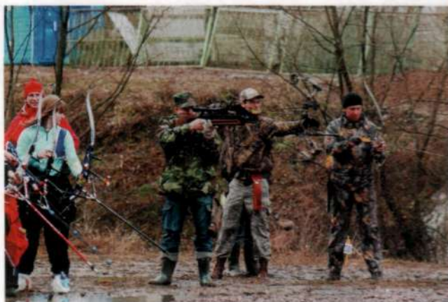
НА СОРЕВНОВАНИЯХ ПО 3D УЧАСТВОВАТЬ МОГУТ НЕ ТОЛЬКО СТРЕЛКИ СО ВСЕМИ ВИДАМИ ЛУКОВ, НО ДАЖЕ С АРБАЛЕТАМИ.

Следующий день стартовый. Оттого, как ты отстреляешь в этот день, зависит, с кем ты будешь бороться за выход в четверть финал. Выглядит это так: первый по списку стреляет, например, с шестнадцатым (последним), второй — с пятнадцатым, третий — с четырнадцатым и так далее. Редко, но случаются ситуации, когда плохо отстрелявший стартовый круг лучник вдруг собирается и побеждает соперника, стоящего, казалась бы, по списку далеко вверху. Естественно, иногда количество участников в группе