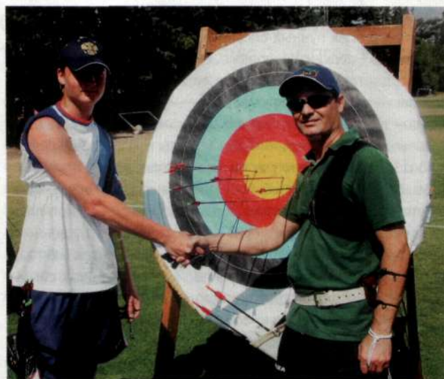
УНИКАЛЬНОСТЬ СТРЕЛБЫ ИЗ ЛУКА ЗАКЛЮЧАЕТСЯ В ТОМ, ЧТО РЕБЁНОК НЕ СТАРШЕ 18 ЛЕТ МОЖЕТ НА ЧЕМПИОНАТЕ МОСКВЫ, РОССИИ ИЛИ МИРА УТЕРЕТЬ НОС ОПЫТНЫМ СТРЕЛКАМ, ЗАНИМАЮЩИМСЯ ЭТИМ СПОРТОМ ПО 10, А ТО И ПО 30 ЛЕТ.