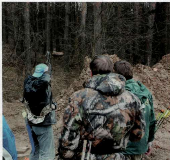
МИШЕНЬМИ НА ТУРНИРАХ ПО 3D СЛУЖАТ ТРЁХМЕРНЫЕ ИЗОБРАЖЕНИЯ ЖИВОТНЫХ ИЛИ ПРОСТО РЕЗИНОВЫЕ ФИГУРКИ.