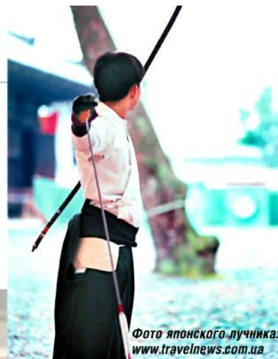
Фото японского лучника: www.travelnews.com.ua

ники на этих соревнованиях стреляли по привязанным голубям. Не стоит забывать и про легендарного Робин Гуда и Вильгельма Телля, которые показали, что и в Англии, и в Швейцарии были великие лучники. В Японии же практиковались Кюдо и Ябусаме, которые возвышали